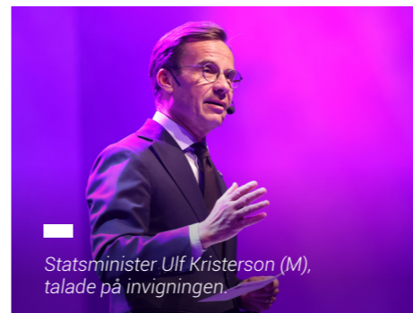
Statsminister Ulf Kristersson (M), talade på invigningen.