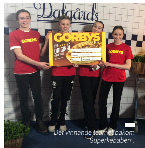
Det vinnande teamet bakom "Superkebaben".

– Entreprenörskap handlar om att hitta svar eller lösningar som ingen annan hittat förut. Att våga sig ut i det okända är lättare om man tidigt får med sig att det är okej att inte ha alla svar från start.