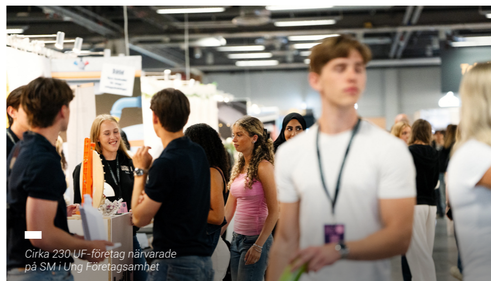
Cirka 230 UF-företag närvarade på SM i Ung Företagsamhet