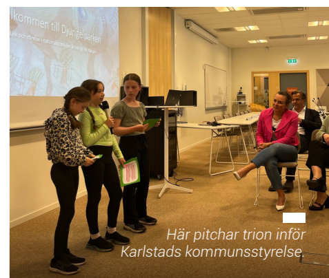
Här pitchar trion inför Karlstads kommunstyrelse.