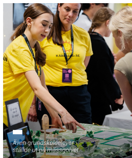
Även grundskoleelever ställde ut på mässgolvet