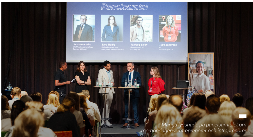
Många lyssnade på panelsamtalet om morgondagens entreprenörer och intraprenörer