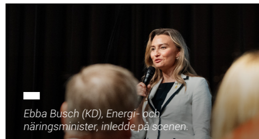
Ebba Busch (KD), Energi- och näringsminister, inledde på scenen.