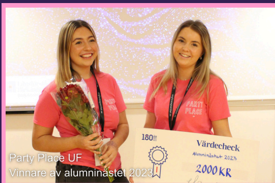
Party Place UF Vinnare av alumninästet 2023

Den 1 december hade vi Alumninästet tillsammans med Länsförsäkringar i Blekinge. Under kvällen fick 8 finalister möjlighet att pitcha sina idéer för en jury bestående delvis av UF-alumner. Detta var en lyckad tävling som avslutades med en prisutdelning där Party Place UF från Gymnasieskolan Knut Hahn tog hem vinsten.