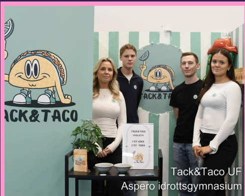
Tack&Taco UF Aspero idrottsgymnasium