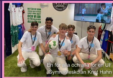
En för alla och alla för en UF Gymnasieskolan Knut Hahn