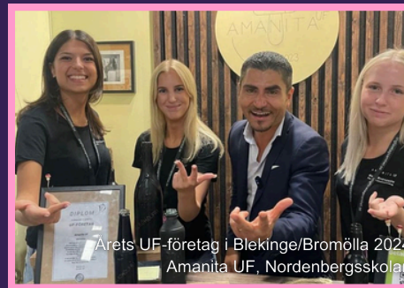
Årets UF-företag i Blekinge/Bromölla 2024 Amanita UF, Nordenbergsskolan

Efter två intensiva och roliga dagar fyllda av säljsamtal och tävlande var det äntligen dags för galamiddag och prisutdelning. Ett av våra UF-företag, En för alla och alla för en UF, kammade hem ett silver i Årets socialt hållbara UF-företag!