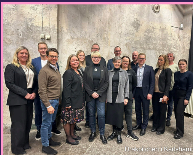
Drakpitchen i Karlshamn