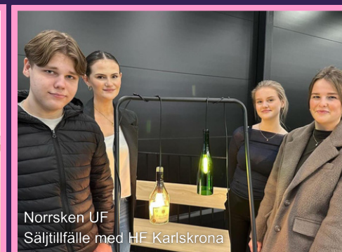
Norrskan UF Säljtillfälle med HF Karlskrona