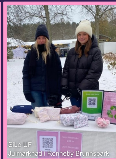
SiLo UF Julmarknad i Ronneby Brunnspark

Nästan alla regionens skolor anordnar pitchtävlingar för sina UF-företag. Under läsåret har vi deltagit på flera av dessa. Att pitcha kan vara väldigt nervöst för många, därför försöker vi vara på plats och peppa UF-företagarna inför deras pitchar. Det märks att dessa tillfällen stärker eleverna och att våga presentera sina idéer är en väldigt bra styrka att ha med sig in i framtida arbetslivet.