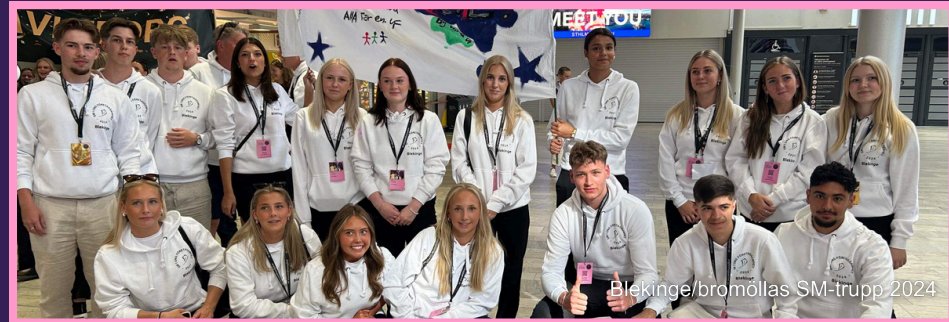
Blekinge/bromöllas SM-trupp 2024