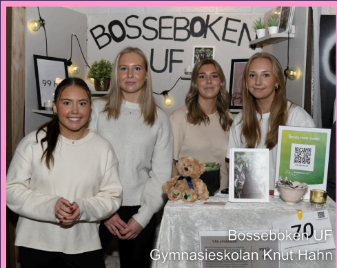
Bosseboken UF Gymnasieskolan Knut Hahn