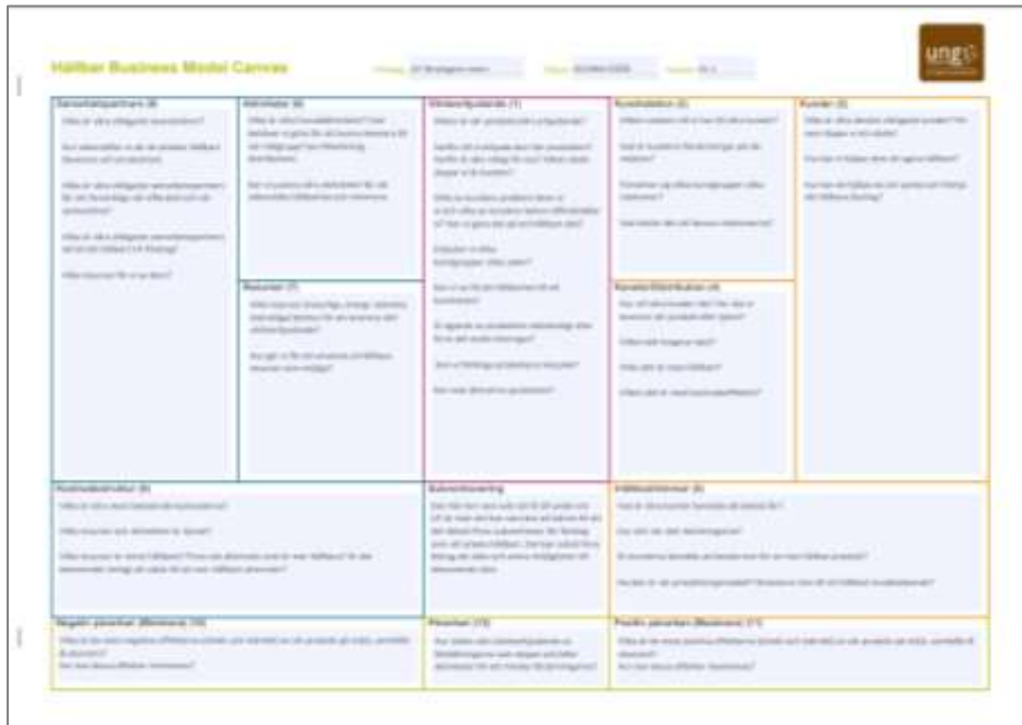
Bild på den hållbara business model canvassen. Finns både som skrivbar Pdf och som worddokument. Eleverna kan fylla i direkt i dokumentet.