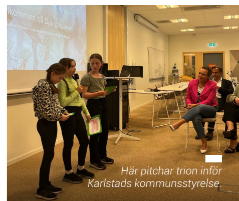
Här pitchar trion inför Karlstads kommunstyrelse.