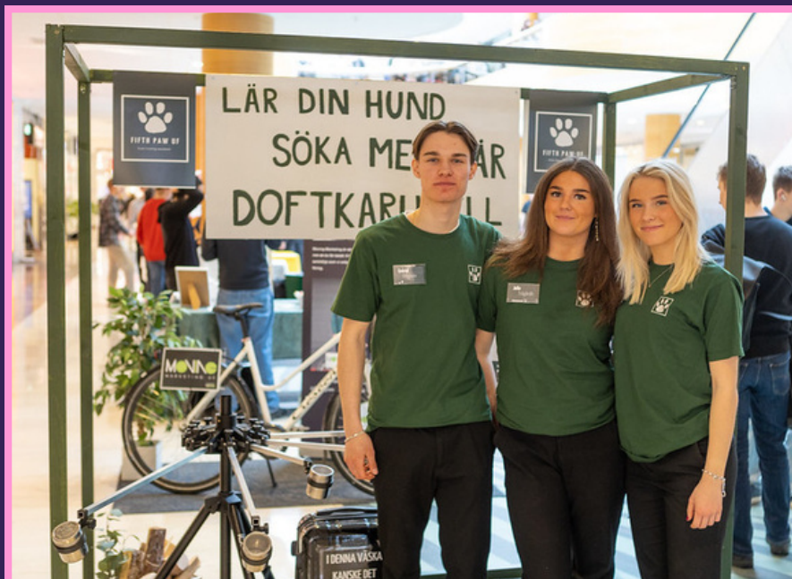
Exempel på hur en ram/ställning runt er utställningsplats kan skapa känslan av "ett rum i rummet".

Varje UF-företag får lov att bygga max 2 meter högt och 80 cm brett. Väljer ni exempelvis att ha en Roll-Up har ni förbrukat era 80 cm i bredd och kan inte ha något motsvarande tex. en hylla med samma mått. En rekommendation är att dela upp era centimeter i bredd, genom att välja inredning man kan "Se igenom", exempelvis en hylla utan baksida. Vi kommer publicera inspirationsbilder på vår hemsida. Upp till 1 meters höjd är det tillåtet att ha en heltäckande inredning, exempelvis en bord med duk. Det viktiga är att inte skymma sikten för andra utställare på mässan. Det kommer inte finnas, och är inte tillåtet att ha monter väggar, då detta kan skymma andra utställare. Det är inte heller tillåtet att bygga/ställa något utanför er mässplats. Inget får gå utanför mässplatsens yta (ni får t ex inte göra fotspår på golvet som leder in till er mässplats) inte heller ha inredning som går utanför mässplatsen.