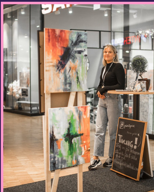
Exempel på hur UF-företagets produkter får en central plats på utställningsplatsen.