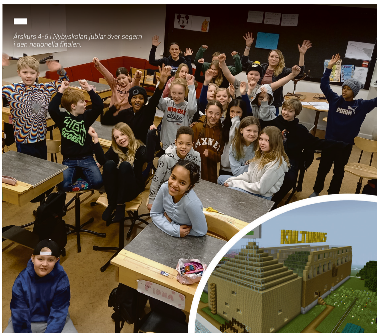
Årskurs 4-5 i Nybyskolan jublar över segern i den nationella finalen.