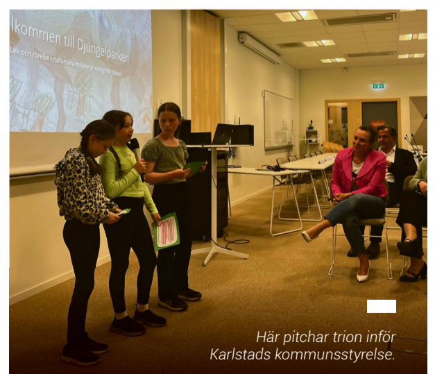
Här pitchar trion inför Karlstads kommunstyrelse.