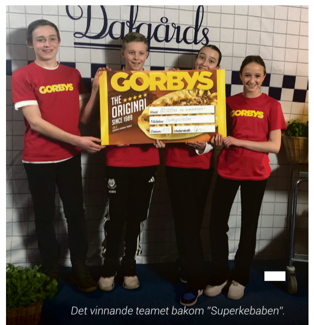
Det vinnande teamet bakom "Superkebaben".

– Entreprenörskap handlar om att hitta svar eller lösningar som ingen annan hittat förut. Att våga sig ut i det okända är lättare om man tidigt får med sig att det är okej att inte ha alla svar från start.