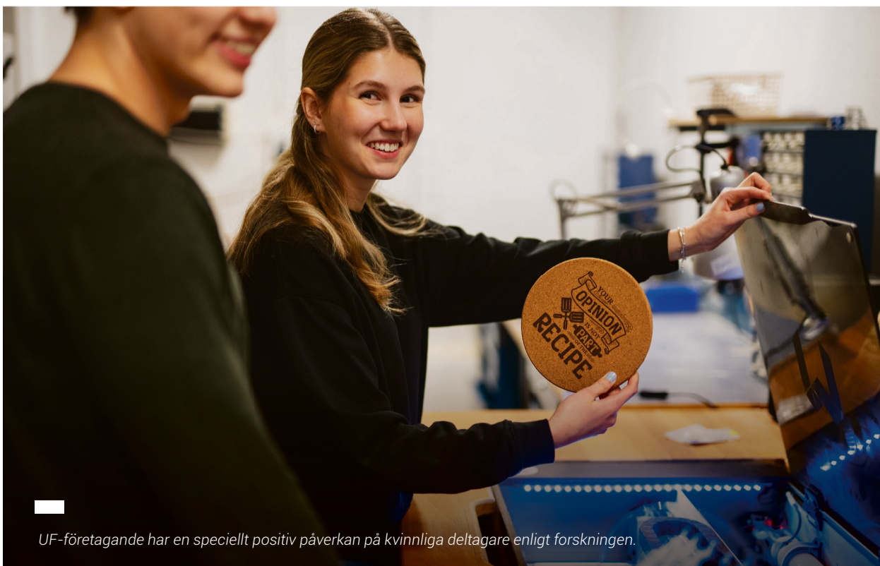
UF-företagande har en speciellt positiv påverkan på kvinnliga deltagare enligt forskningen.

– Entreprenörskap utvecklar färdigheter som är användbara både inom arbetslivet och i livet generellt. Det handlar om att ta initiativ, vara kreativ, lösa problem, kommunicera effektivt och planera. Sverige har också över lång tid byggt hela sitt välstånd tack vare skickliga entreprenörer.